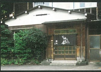
⑩ 花火そば 徳 七 ☎82-5076