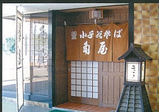
④ 角屋サンブラザ店 ☎83-4648