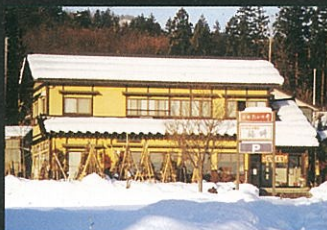
⑦ 福 栴 ☎82-2624