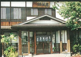
⑧ 須 坂 屋 ☎82-3295