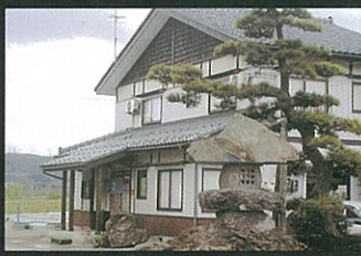
⑨ そば処やまぐち ☎82-0882