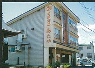
③ わたや本店 ☎82-2258