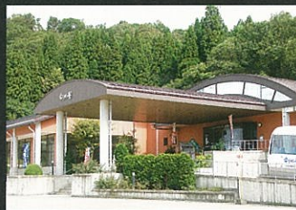
① 岩藤屋 ☎82-2673