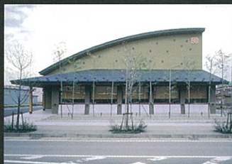
⑤ わたや平沢店 ☎83-0588