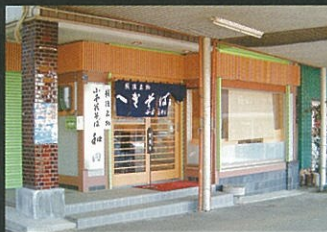
② 小千谷そば和田 ☎83-3283