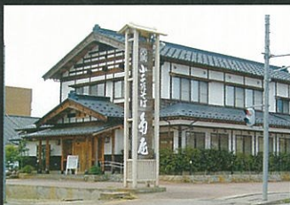
⑥ 小千谷そば角屋本店 ☎83-2234