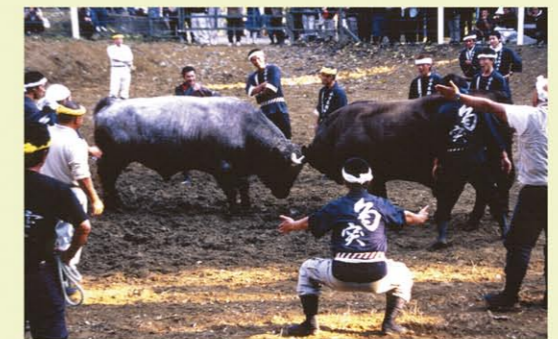
鬥牛 牛の角突き MAP C 5 隨著「yosita!」的吆喝聲互相衝撞的鬥牛場面，以及勢子壓制住牛隻的絕妙美技，再再引起觀眾的歡呼聲。這項傳統活動，曾在江戶時期的暢銷書「南總里見八犬傳」裡出現。