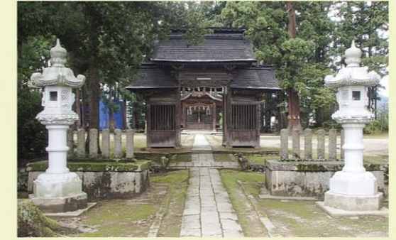
魚沼神社 阿彌陀堂 MAP D 3 魚沼神社興建於室町時代（1563年），被指定為國家重要文化財產。戰國時代，赫赫有名的上杉謙信出兵關東之際，曾在此舉行祈求勝戰的儀式。