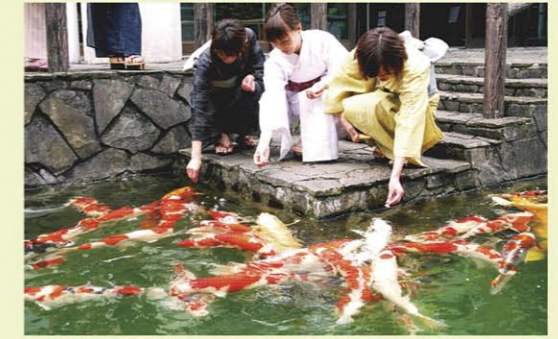
錦鯉的故鄉 錦鯉の里 MAP D 3 鄰近SUNPLAZA，在以天然石頭搭建的美麗日本庭園中，可鑑賞到約40種的錦鯉。也能近距離地餵魚。