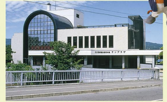
SUNPLAZA サンプラザ MAP D 3 土產、特產、觀光等小千谷的一切皆應有盡有的觀光據點。除了能實際體驗紡織外，還能享受美食。位於市區，擁有廣大的停車場，十分便利。