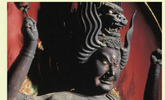
妙高寺 木造愛染明王坐像 MAP F 4 妙高寺的主佛，為國家的重要文化財產。也因掌管愛情而著名。每个月的26日，愛染明王坐像會開帳供民眾參拜。