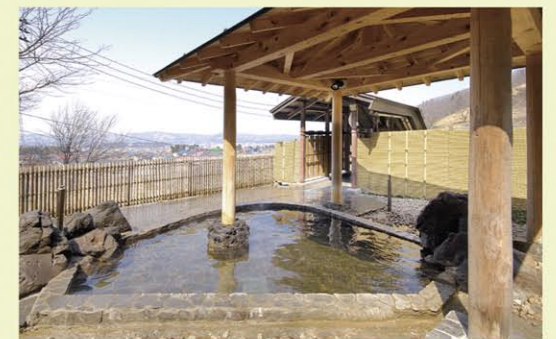
當日往返溫泉 湯處「縮之里」 日帰り温泉 湯どころ「ちぢみの里」 MAP D 4 男女分開的2個大浴場各有露天溫泉、三溫暖和按摩浴缸。此外，也有可以讓人消除旅途勞頓的岩盤浴。還能吃到當地名產小千谷蕎麥麵。