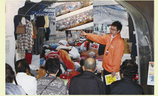
小千谷地震博物館「防備館」 震災ミュージアム「そなえ館」 MAP D 3 2004年10月23日發生芮氏規模6.8的地震，震源在中越地方。這座博物館除了展示從地震發生到重建後的時間序列，也有設備讓民眾可以實際體驗。